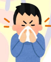
避免手部接觸口鼻